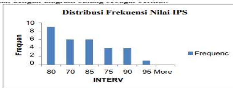
Gambar 4.2 Diagram Batang Distribusi Frekuensi Nilai IPS

Berdasarkan tabel distribusi frekuensi data nilai IPS pada penelitian ini dapat digambarkan dengan diagram batang sebagai berikut: