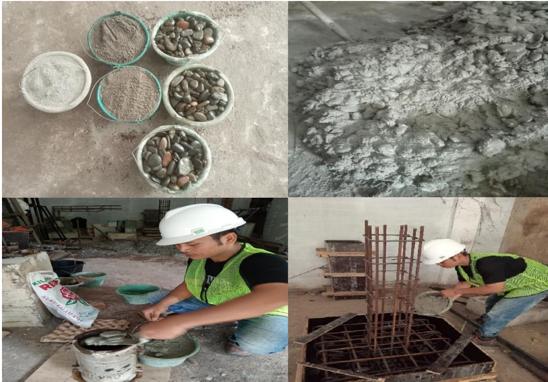
Gambar 1. Pembuatan Benda Uji Kubus dan Silinder

penelitian. Setelah perekat mengeras, uji tarik dilakukan menggunakan alat Jack Hydraulic. Beban tarik diberikan secara bertahap hingga terjadi kegagalan pada rebar atau beton. Data hasil uji tarik dicatat untuk dianalisis guna menentukan kedalaman optimal yang menghasilkan kuat tarik maksimum.