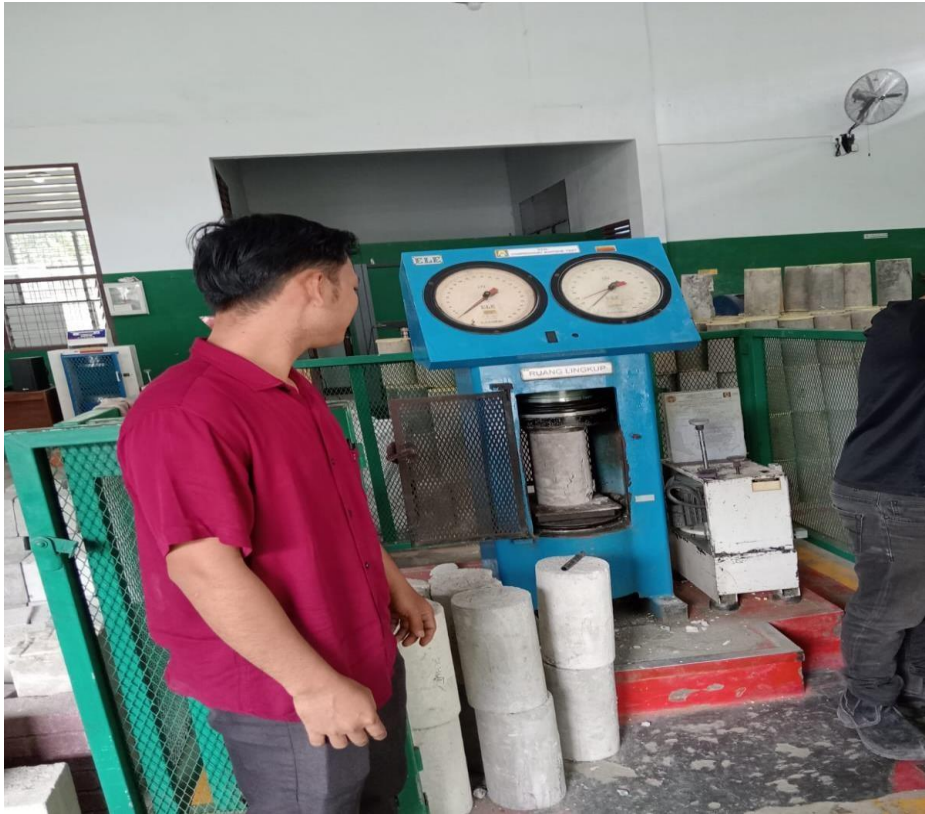
Gambar 3. Uji Tekan Beton di Laboratorium