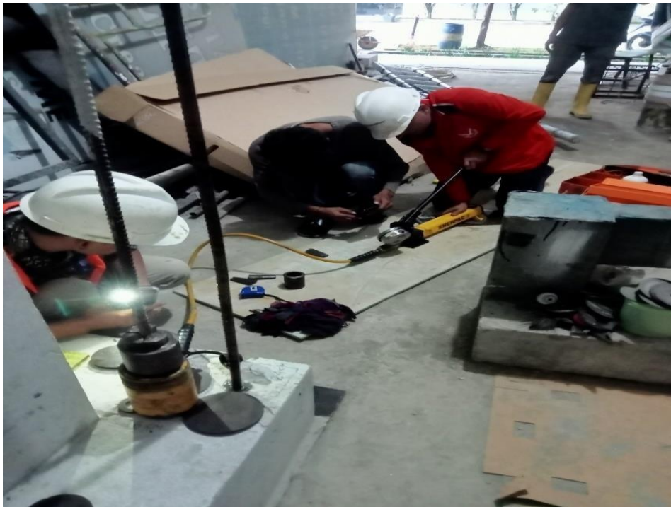
Gambar 4. Uji Tarik Baja Tulangan (Rebar)