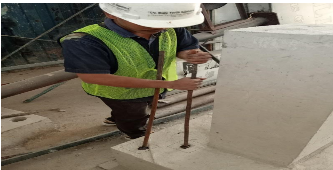
Gambar 2. Pemasangan Rebar pada Benda Uji Tarik